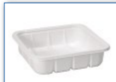
MC 1000 M6 178 x 165 x 45 mm