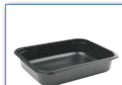
MC 3001 312 x 245 x 63 mm