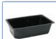
MC 1300 210 x 148 x 56 mm