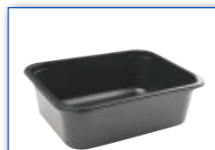
MC 5001 312 x 245 x 100 mm

MC = pojemność tacki w ml CE = Centralna Europa NE = Północna Europa