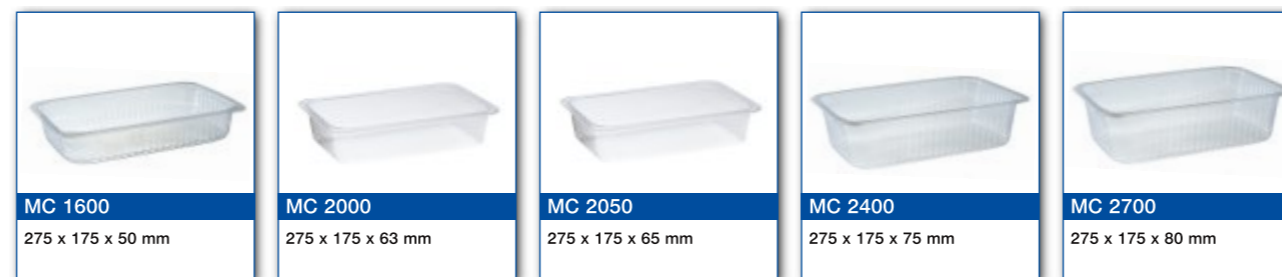
MC 1600 275 x 175 x 50 mm