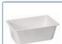
MC 1500 210 x 148 x 70 mm