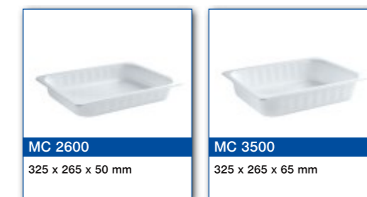
MC 2600 325 x 265 x 50 mm