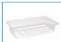
MC 1650 M4 265 x 165 x 54 mm