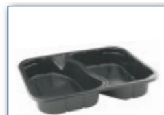
MC 2501-2 312 x 245 x 54 mm