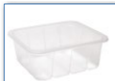
MC 1300 M6 178 x 165 x 70 mm