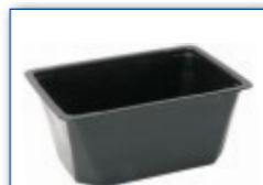
MC 1750 210 x 148 x 90 mm