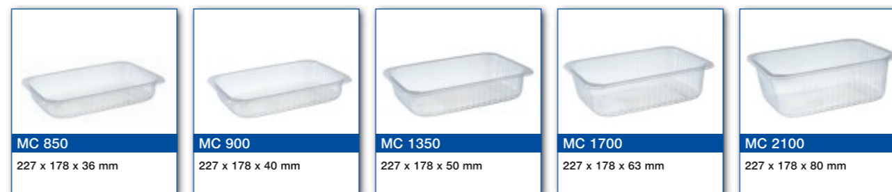
MC 850 227 x 178 x 36 mm