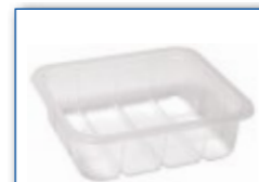
MC 1100 M6 178 x 165 x 54 mm