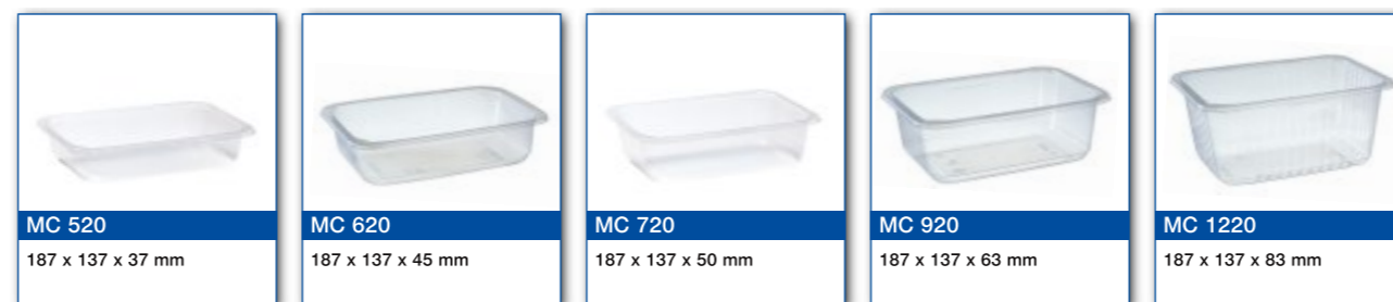
MC 520 187 x 137 x 37 mm