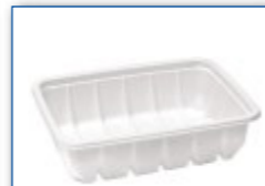
MC 1005 195 x 144 x 51 mm