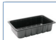
MC 1801 M4 265 x 165 x 61 mm