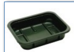
MC 400 M8 165 x 132 x 35 mm