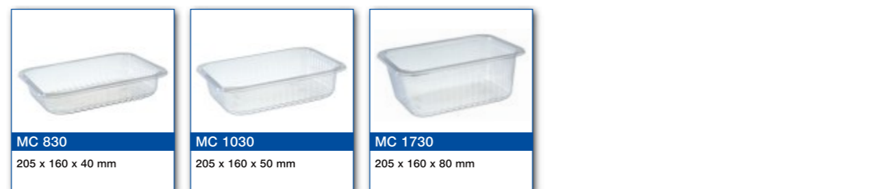
MC 830 205 x 160 x 40 mm