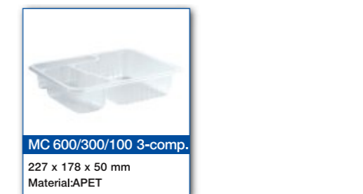
MC 600/300/100 3-comp. 227 x 178 x 50 mm Material: APET

MC = pojemność tacki w ml CE = Centralna Europa NE = Północna Europa