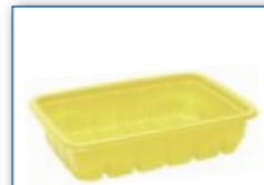
MC 855 195 x 144 x 43 mm