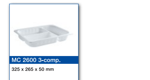
MC 2600 3-comp. 325 x 265 x 50 mm