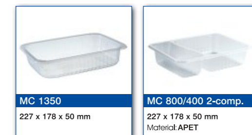
MC 1350 227 x 178 x 50 mm