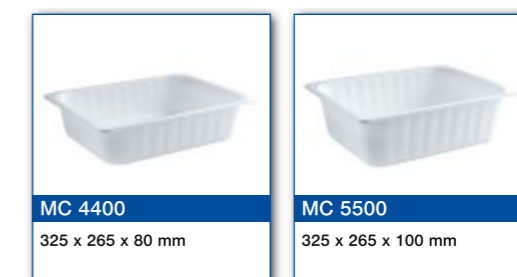
MC 4400 325 x 265 x 80 mm