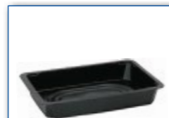
MC 700 210 x 148 x 32 mm