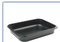
MC 2501 312 x 245 x 54 mm