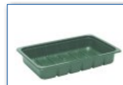
MC 1200 M4 265 x 165 x 43 mm