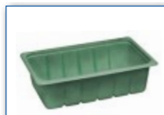
MC 2200 M4 265 x 165 x 75 mm

MC = pojemność tacki w ml CE = Centralna Europa NE = Północna Europa