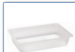
MC 850 210 x 148 x 40 mm