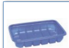
MC 705 195 x 144 x 35 mm