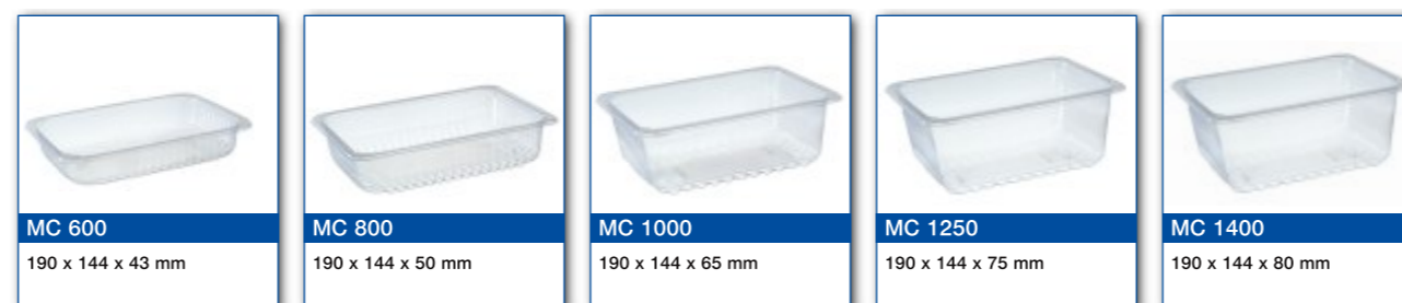
MC 600 190 x 144 x 43 mm